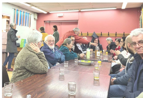
Moment de convivialité à La Versanne après la messe du samedi soir

Samedi 20 mai à Graix à 18h après la messe. Mercredi 24 mai à 18h30 à la chapelle St Régis. Samedi 27 mai à St Julien à 18h après la messe (Pentecôte). Mercredi 31 mai à 18h30 à la chapelle St Régis.